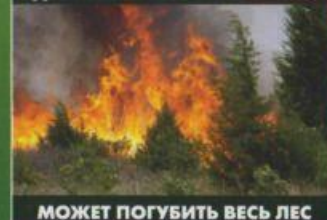
МОЖЕТ ПОГУБИТЬ ВЕСЬ ЛЕС

Виновники пожаров ответственность несут! Мера наказания назначает суд!