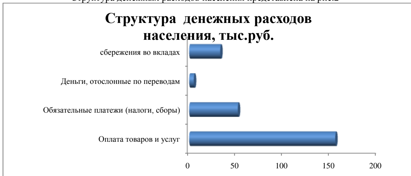
Рис.2 структура денежных расходов населения

Структура денежных расходов населения представлена на рис.2